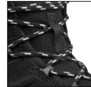
Schnürelemente mit Reflex