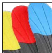
Vario Wide Fit System