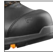
HAIX® Composite Schutzkappe