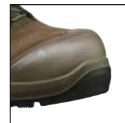
HAIX® Nano-Carbon Schutzkappe