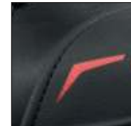
GÜK mit versenkten Nähten