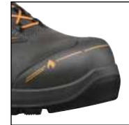
HAIX® Nano-Carbon Schutzkappe