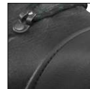
GÜK mit versenkten Nähten