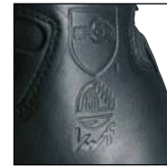
Schnittschutz Level 1